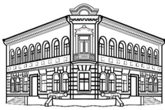
БРЕСТСКИЙ ОБЛАСТНОЙ КРАЕВЕДЧЕСКИЙ МУЗЕЙ