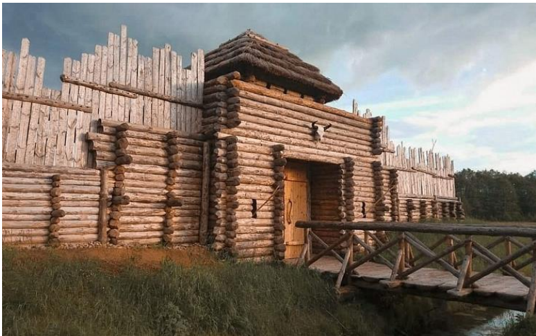
Археалагічны музей пад адкрытым небам у Белавежскай пушчы