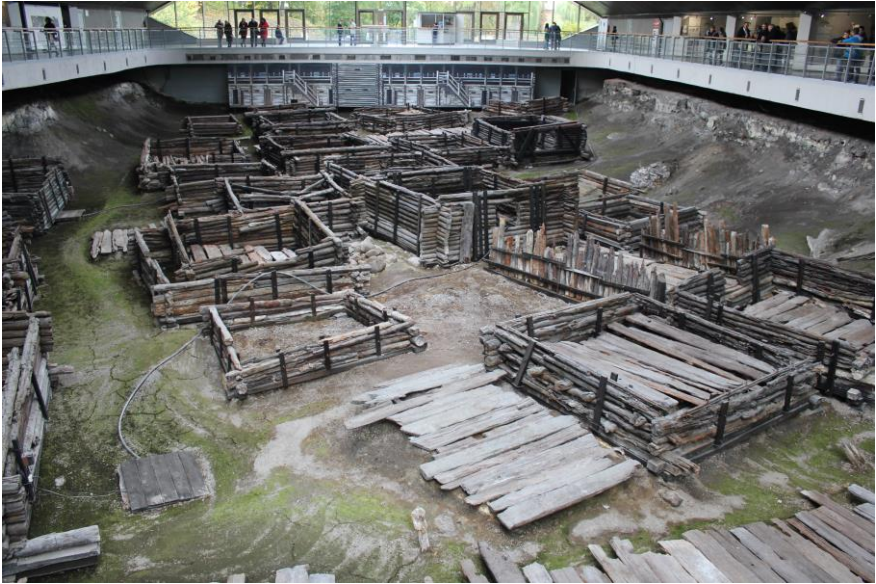
Археалагічны музей «Бярэсце»