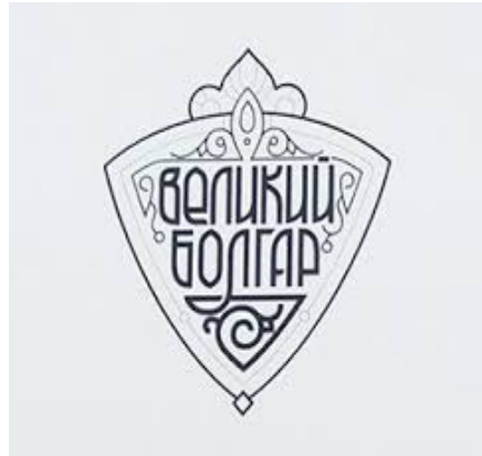
Bolgar State Historical and Architectural Museum-Reserve