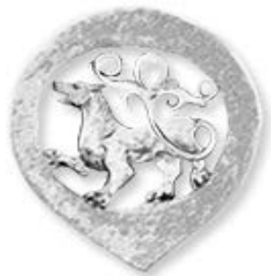
Институт археологии Академии наук Республики Татарстан