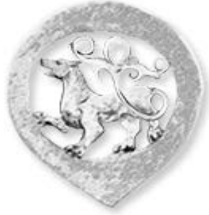
Khalikov Institute of Archaeology Tatarstan Academy of Sciences